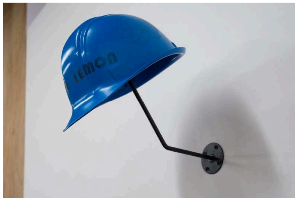
Firm Lemon #Helmet [Sculpture] 2022/Painted and printed helmet/26 x 30 x h15 cm

2022/Label Printed, 96 bottles/44.5 x 60 x h12 cm