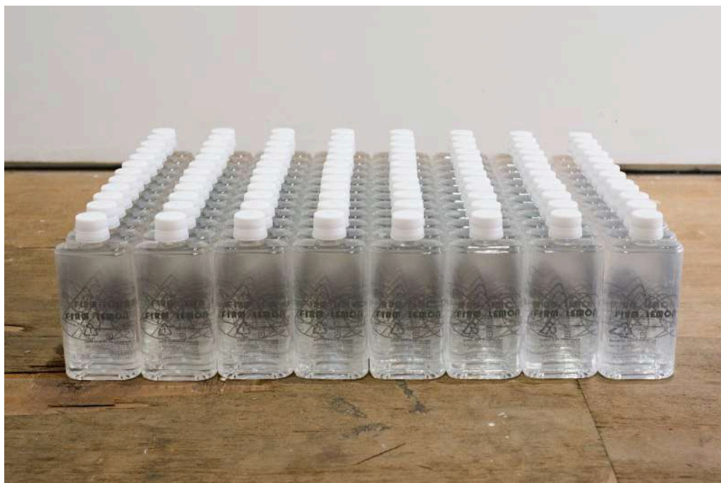
Firm Lemon #Water [Sculpture]

2022/Label Printed, 96 bottles/44.5 x 60 x h12 cm