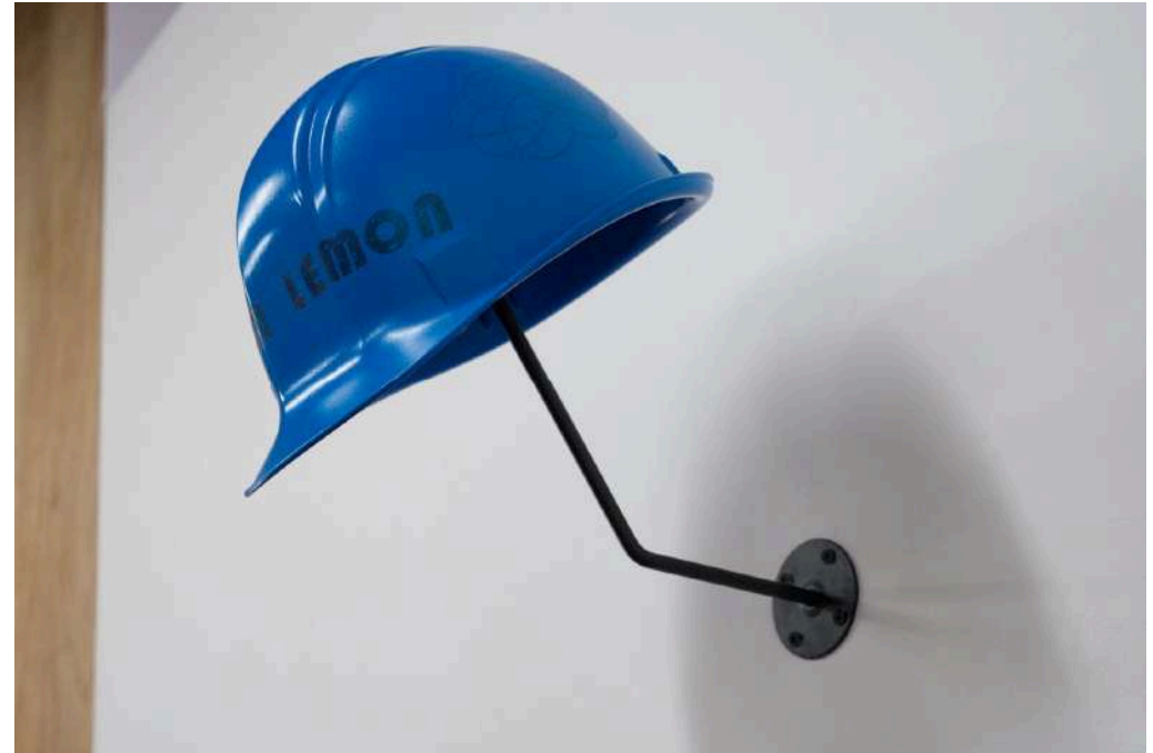
Firm Lemon #Helmet [Sculpture] 2022/Painted and printed helmet/26 x 30 x h15 cm

2022/Label Printed, 96 bottles/44.5 x 60 x h12 cm