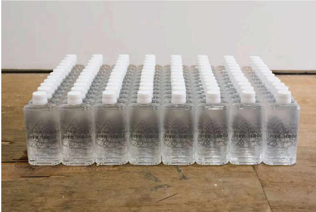
Firm Lemon #Water [Sculpture]

2022/Label Printed, 96 bottles/44.5 x 60 x h12 cm